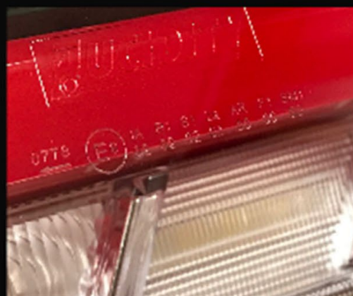
レンズ ECE 認証印字