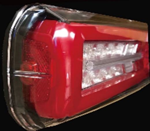
SMD 2灯式サイドマーカー&リフレクター