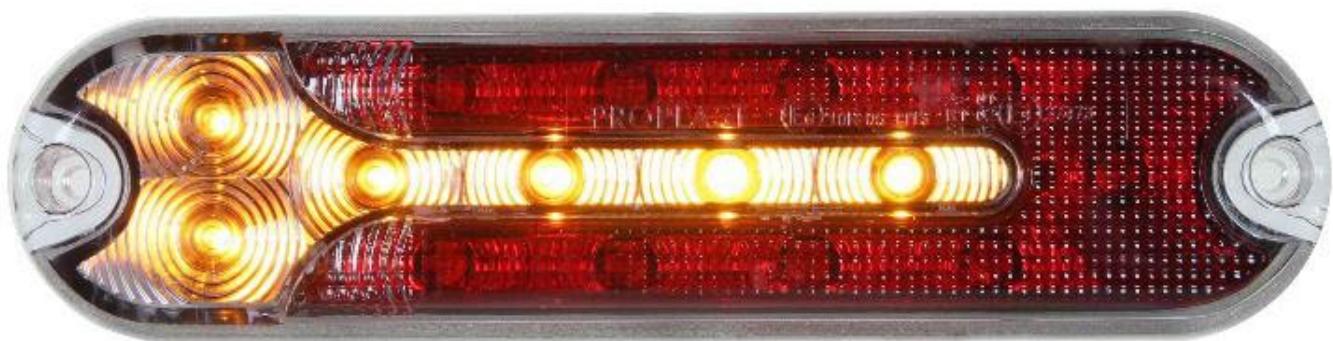
シーケンシャルウィンカー